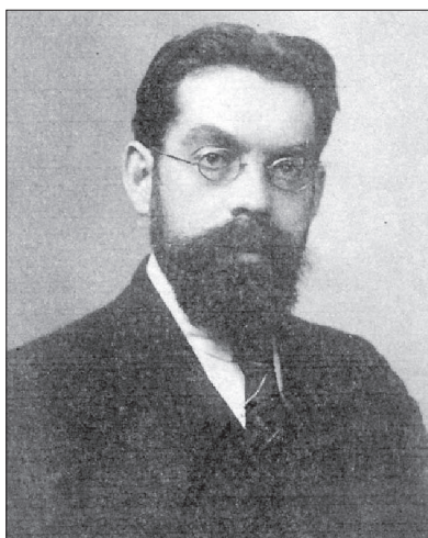
Рис. 1. Фото І. Красковського

Ключові слова: білоруський футбол, Іван Красковський, Вільнюс.